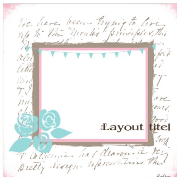
Skitse til Layoutopgave 1