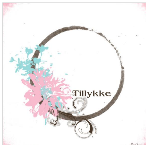
Skitse til Kortopgave 1